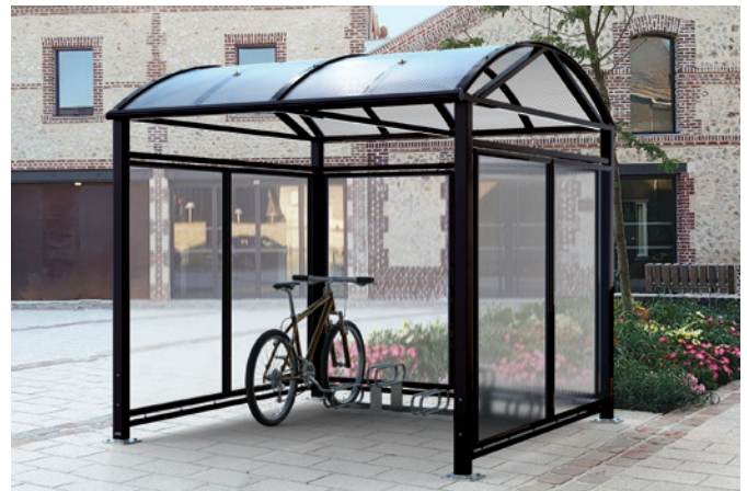
Réf. 529082 + 204719