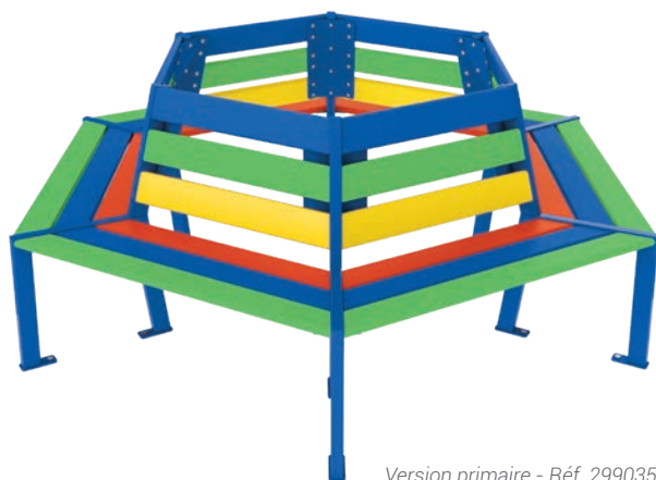
Version primaire - Réf. 299035