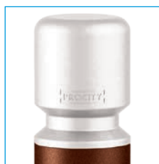
Système d'amovibilité pour potelets Serrubloc® 21