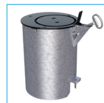
Fourreau d'amovibilité verrouillable