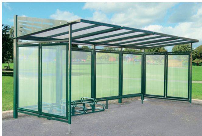
Réf. 529614 + 204105 + 204711