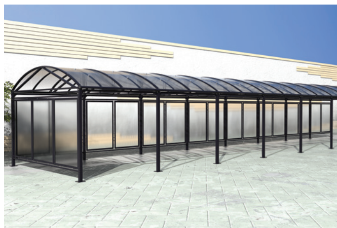
Réf. 529070 + 529071 + 529073 + 529074 + 529075