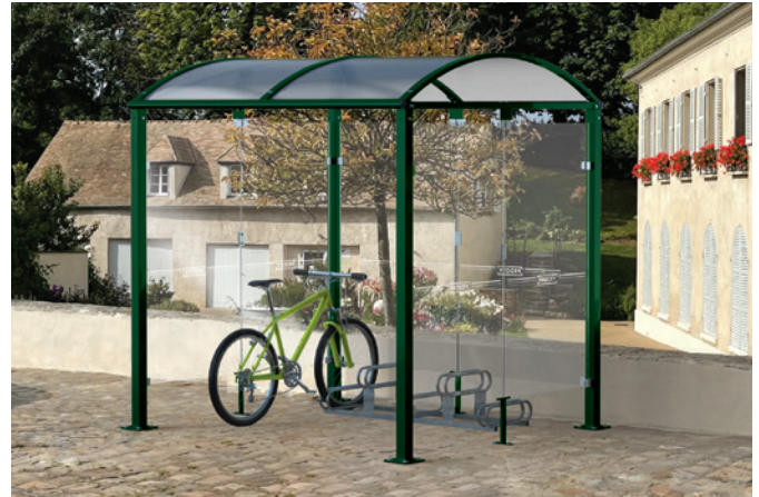
Réf. 529022 + 204719